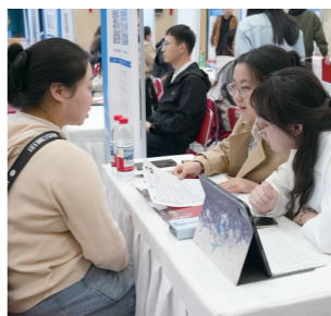
企业与人才双向奔赴