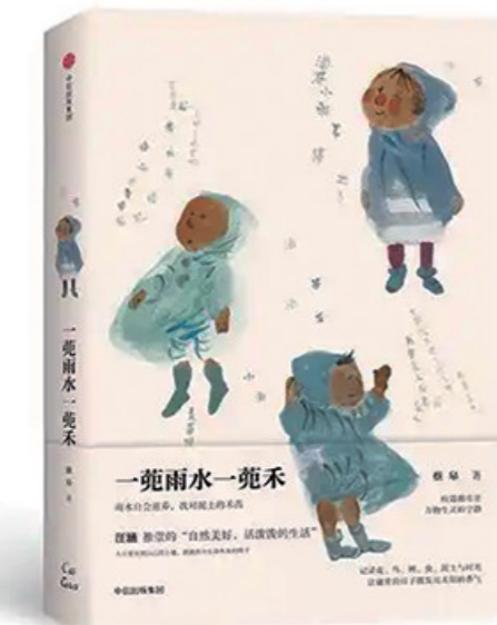
《一苑雨水一苑禾》书影