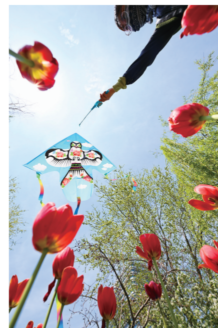
滨州秦皇河春日郁金香生态文旅区美如画卷

在滨州经济技术开发区狮子刘村,黄河岸边正绘就美丽乡村新图景;探访惠民淄角镇跨村联建示范点蓝莓种植基地,感受特色农业赋能乡村振兴的生动实践;打卡高新区万物生·颐福园,体验康养融合的乡村发展新模式,全方位感受黄河岸边群众的幸福生活,书写了黄河流域民生改善的滨州样板。