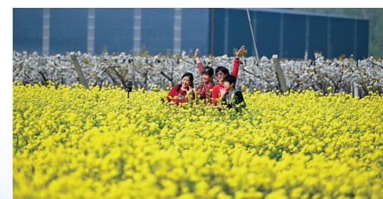
春花绽放的滨州成为不少游人打卡的好去处