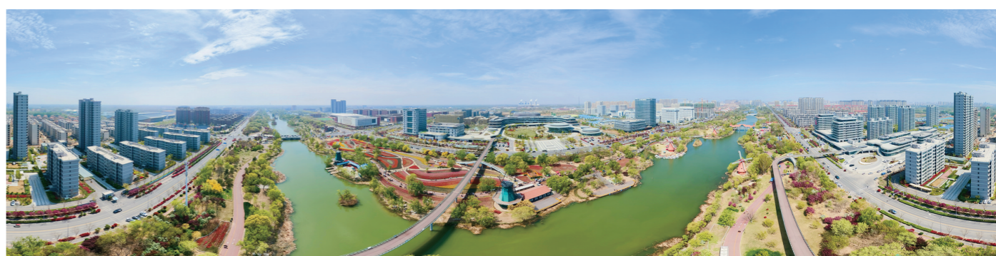
滨州市区景色如画

取各方建议,不断创新活动形式、优化服务内容,让更多残疾人在关爱中共享城市发展成果,拥抱幸福。