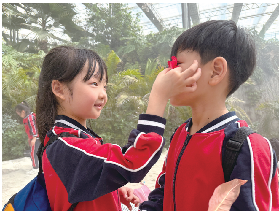
美丽的环境激发起小朋友对美的向往

四月的敕勒川现代农业产业园(以下简称产业园),春风还带着些许凉意,但玻璃温室里已是一片葱茏。一群四五岁的孩子正围着一棵芭蕉树仰头张望,小手指着那比巴掌还大的叶片,发出一连串的惊叹。这是包钢十六园一年来第十二次“行走的课堂”——从去年春天到今年春天,这支“小小探险队”曾在阿尔丁植物园观察蚂蚁搬家,在北方兵器城触摸退役坦克的装甲,在赛汗塔拉冰雪大世界的雪地里追逐嬉戏,在包头市科学技术馆动手探索科学奥秘,在鹿城阅读书店感受书香,甚至远赴内蒙古自然博物馆与远古化石对话。