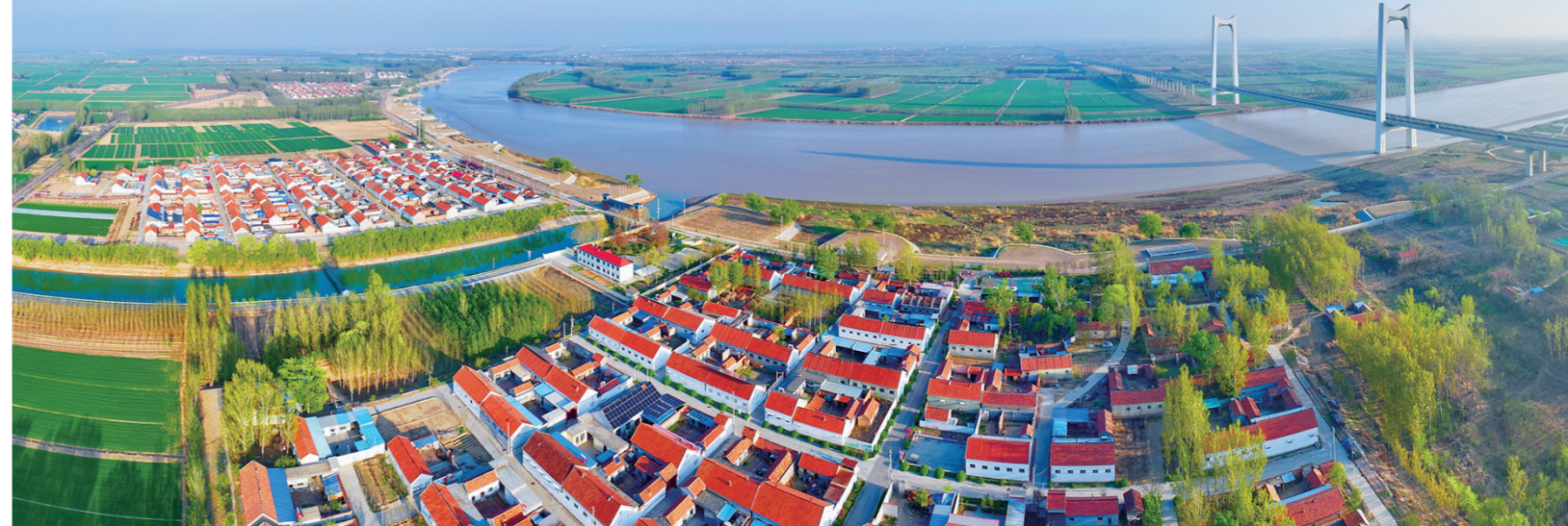
黄河之水奔腾不息,为滨州产业发展注入不竭动能。