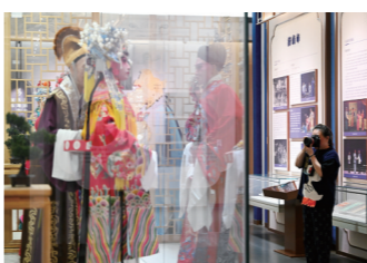
感受地方文化魅力

活动中,媒体团走进山东昊润自动化技术有限公司、山东广富集团530精品钢管生产线、香驰控股有限公司,见证高端制造的硬核实力;探访山东泰义金属科技有限公司、金佰特商用厨具有限公司感受专精特新企业魅力;走进惠民李庄绳网