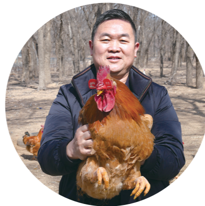
肥美的散养红公鸡