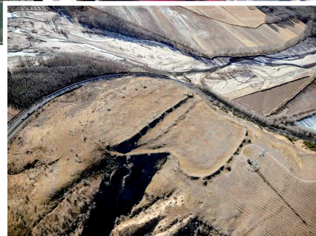
尹家店山城古遗址

漠，累计飞行超过3500小时，拍摄了近万张大画幅胶片。他用镜头发现了地面难以辨识的秦代与隋代长城并行奇观，记录下濒临沙化的西夏黑城子遗址，更让呼和浩特大青山秦汉长城、乌兰察布三角古城等珍贵遗产走进了考古学家的视野。