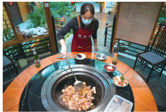
美味的柴火鸡即将出锅