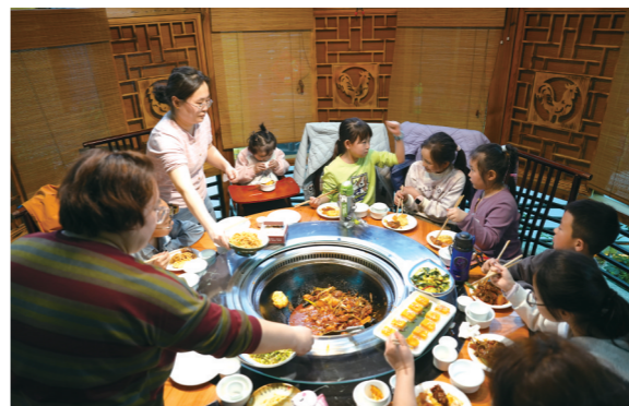
地锅柴火鸡让游客们回味无穷