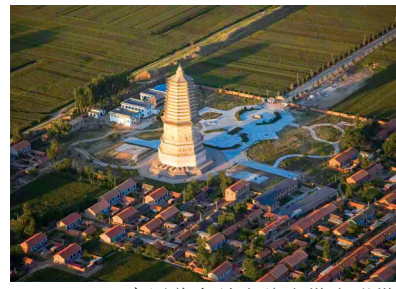
中国体积最大的古塔大明塔