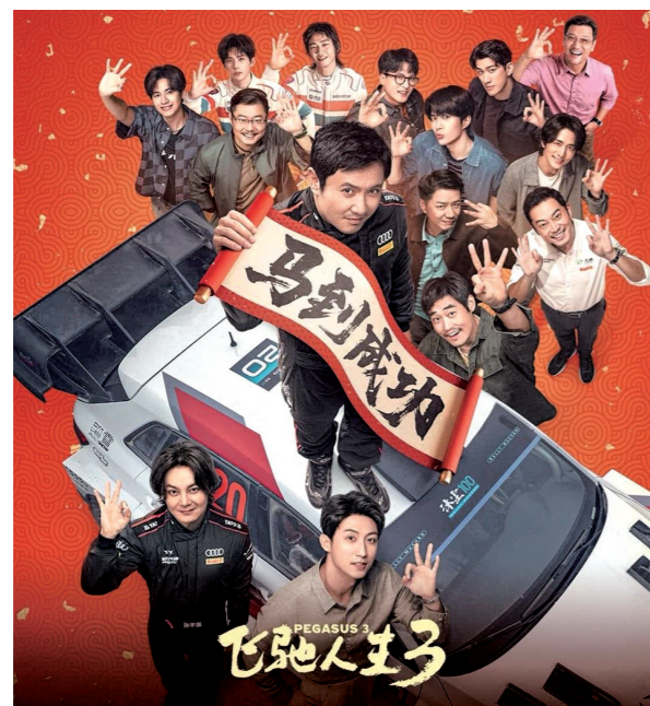
《飞驰人生3》观影人次突破 6000 万海报