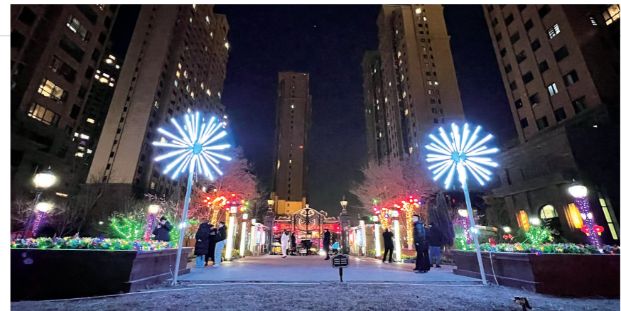
正翔国际小区灯饰