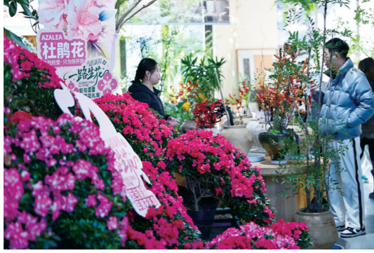
鲜花市场人气旺