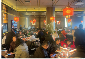
餐饮业烟火气十足