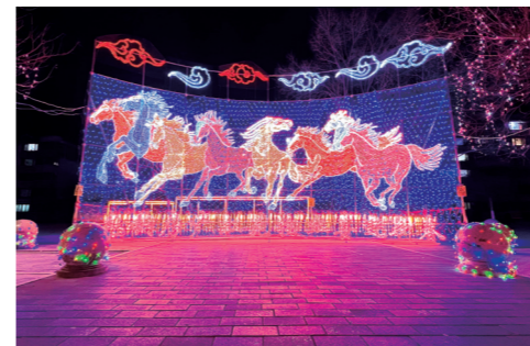
明日星城德景苑《骏马图》灯饰