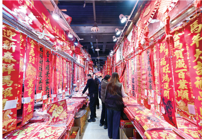
市民选购春联