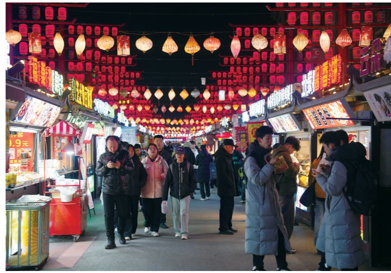
横竖街人头攒动