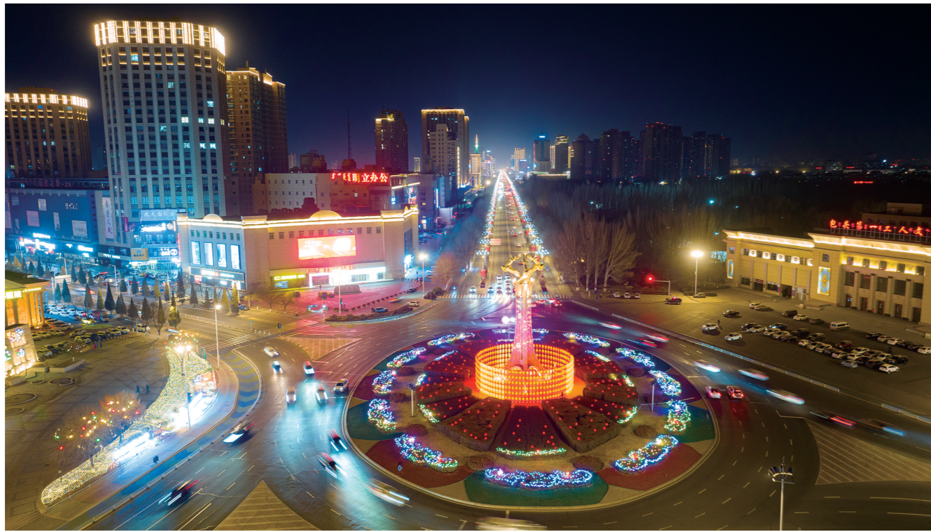
一官环岛被各色彩灯装饰一新