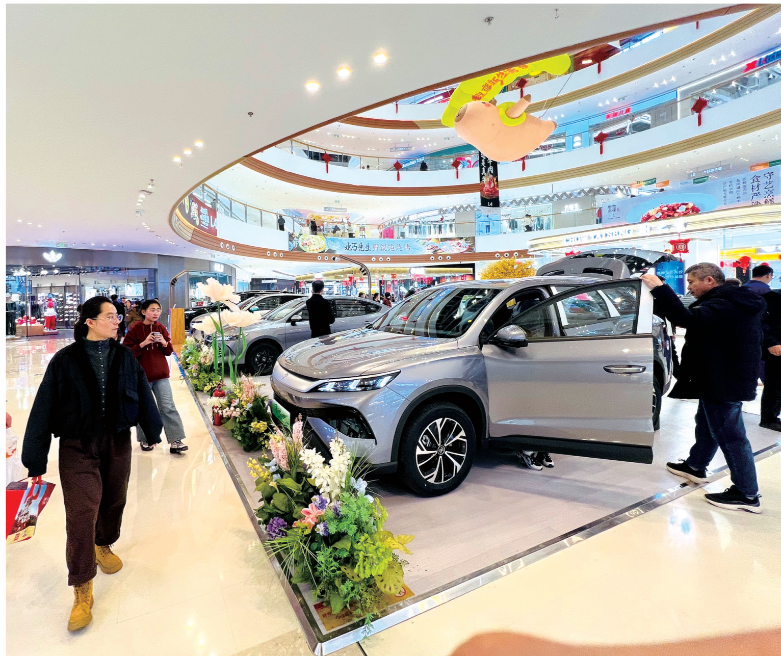
1月24日,多款新能源汽车亮相的“迷你车展”走进我市市区一家商场。得益于各项补贴政策,各款车型超高性价比吸引了众多市民驻足咨询。