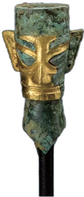
戴金面罩青铜人头像

青铜人头像、纵目面具、太阳神鸟金饰……1月18日,由国家文物局指导,中国国家博物馆、四川省文物局主办的“双星耀世——三星堆—金沙遗址古蜀文明展”在京开幕。本次展览荟萃三星堆—金沙遗址出土的200余件(套)精美文物,反映古蜀先民的生活与精神世界,揭示古蜀文明与中原地区及长江中下游地区的密切联系。