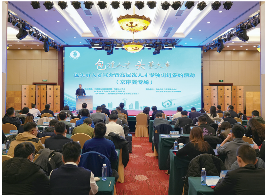
活动中，包头籍在京高层次人才代表发言。