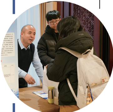
我市企业招聘人员与人才现场交流