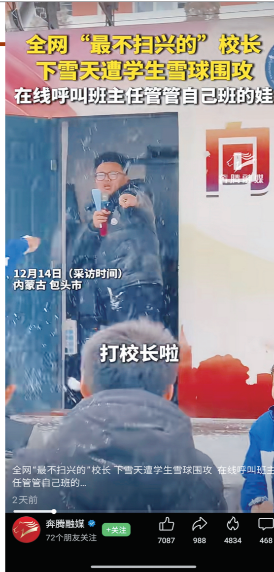
奔腾融媒视频报道截图