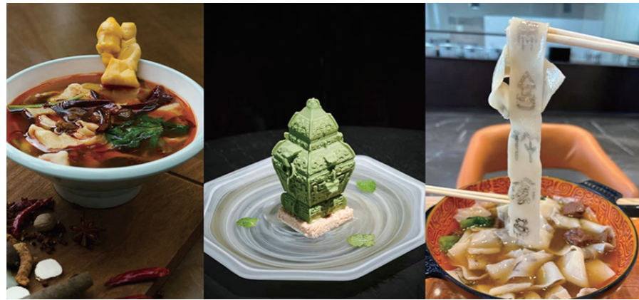
图为“长信宫灯”板面、皿方壘慕斯蛋糕、甲骨文面。

近期,全国多地博物馆陆续开设食堂,“去博物馆‘干饭’”备受年轻人追捧:在辽宁省博物馆吃一顿22元的荤素盖浇饭,到湖北省博物馆来一碗编钟牛肉面,去内蒙古博物院品尝一套地道的烧麦……如今的年轻人逛博物馆,不仅仅满足于“看文物”,更是把食堂当作必打卡的“隐藏副本”。