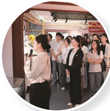
北大大师生参观“齐心协力建包钢”展馆

未来，包头能否以“名城”为新起点，将深厚底蕴转化为可持续的创造力和凝聚力，让历史真正照耀未来，这比“名城”本身更值得期待。