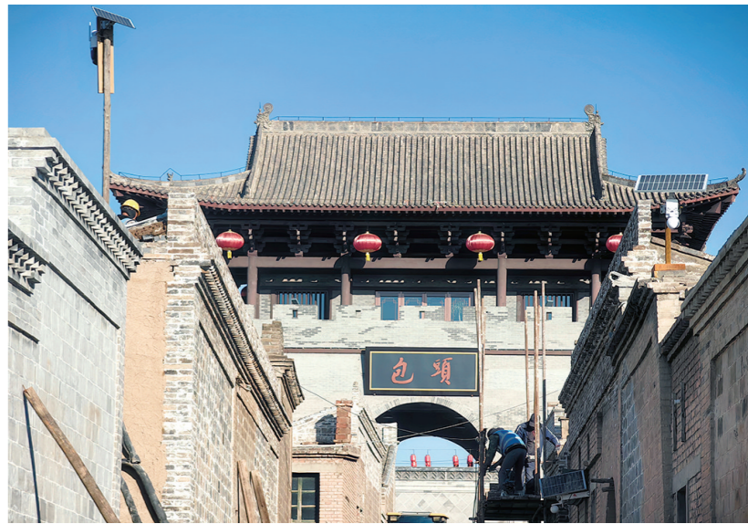
老包头走西口历史文化街区一角

走进老包头走西口历史文化街区，青砖灰瓦的建筑错落分布，精美的木雕、砖雕、石雕随处可见。这里是西口文化