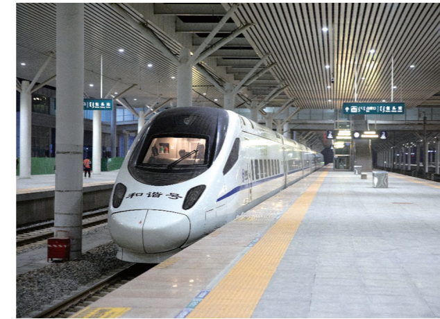
正在进行序列验证的动车组列车驶出包头火车站

为确保施工安全有序、运输组织平稳,包头火车站施工前一周即完成安全技术检查与隐患排查,明确各单位职责分工与作业标准;施工当晚严格执行电子、纸质“双登记”制度,管理人员分片包保、全程盯控,对道岔解锁、防护布置、人员撤离等重点环节逐项把关,所有作业全程记录仪摄录,确保流程规范可追溯。提前完成相关车次的接发与车底入库安排,为站场封锁创造有利条件。