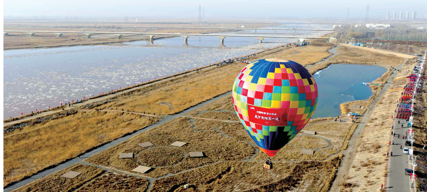
乘坐热气球从空中俯瞰黄河