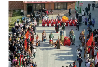
近500万！黄河观凌季火出圈 2025年11月30日 包融媒