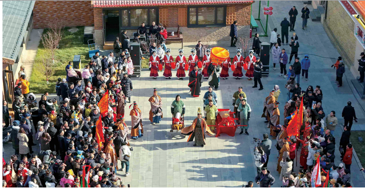
沉浸式情景剧表演