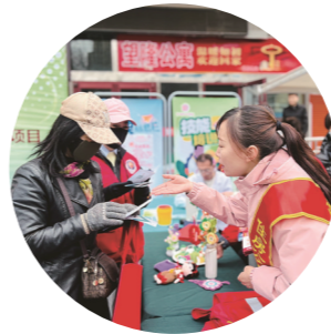
工作人员为居民解读就业政策