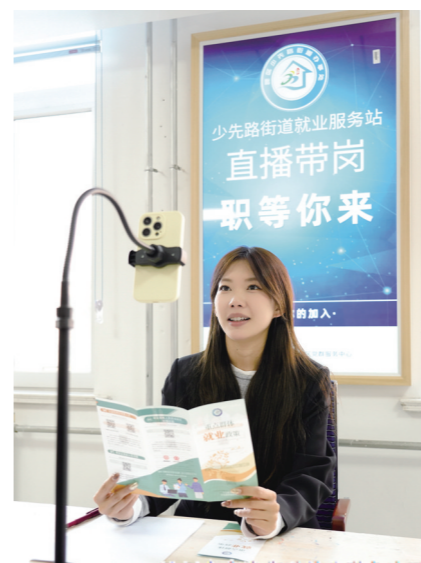
昆区少先路街道就业服务站开展直播带岗