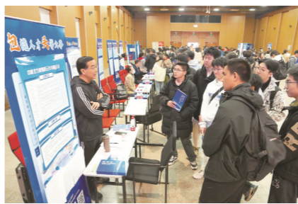
面向高校毕业生专场招聘会

就业,一头连着千家万户,一头连着经济大局。回望“十四五”,我市以发展促就业、以就业保民生,用政策温度、服务精度、创新力度,持续健全就业促进机制,让高质量就业成果惠及更多群众,为建设宜居宜业的现代化城市注入源源不断的民生力量,为全市经济社会高质量发展提供了坚实支撑。