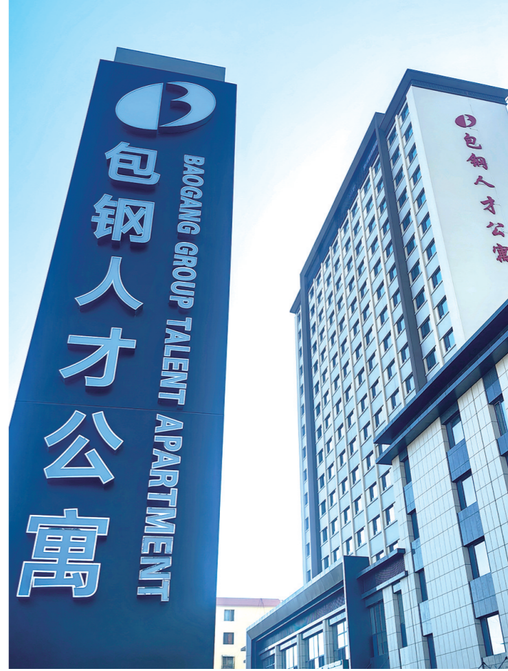
包钢(集团)公司人才住房项目