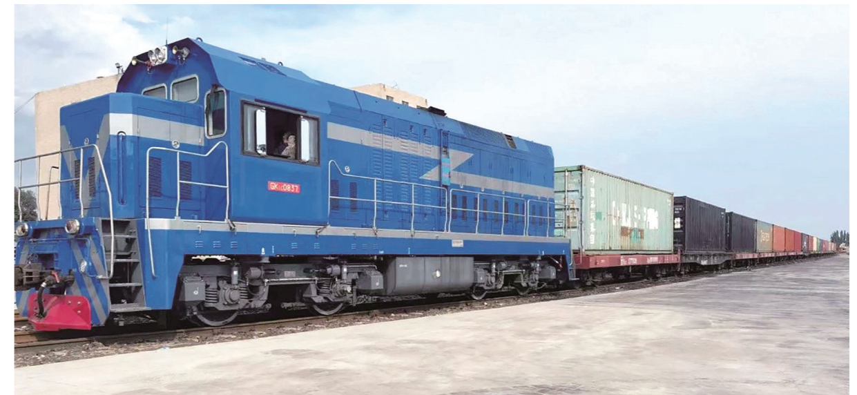
中欧班列(包头—莫斯科)从包头市国际陆港鸣笛启程

如果说过去的开放是“借船出海”，那么今天的包头，正在用自己的双手“造船远航”。过去，电商企业想做跨境贸易，常常面临通关、物流、结汇等“多头跑”的烦恼。如今，包头市跨境数字经济产业园作为整合跨境贸易、数字技术、产业服务的专业化平台，可助力园区企业“一键链全球”。它不仅是一个物理空间，更是承载包头开放合作重任的一艘“航船”。在这里，跨境电商综合服务中心、全球跨境电商数据中心、跨境产教融合示范中心协同联动，实现从“单一服务”“分散运营”到“全链条保障”“集群发展”的转变，不仅填补了我市跨境数字经济集中承载空白，更为本土外贸企业搭建起连接全球市场的“快车道”。今后，无论是闪闪发光的稀土，还是“大国重器”的装备，我们的“包头制造”都能通过这条“数字丝路”，更快、更高效地走向世界。作为园区新成员，内蒙古鑫钰电子商务有限公司对于全链条、一站式的出海服务有着真切感受。“园区为企业提供了很多便利条件和商机，从入驻到现在，公司在新手店铺基本上每天销量30-50单。我们信心满满，后续