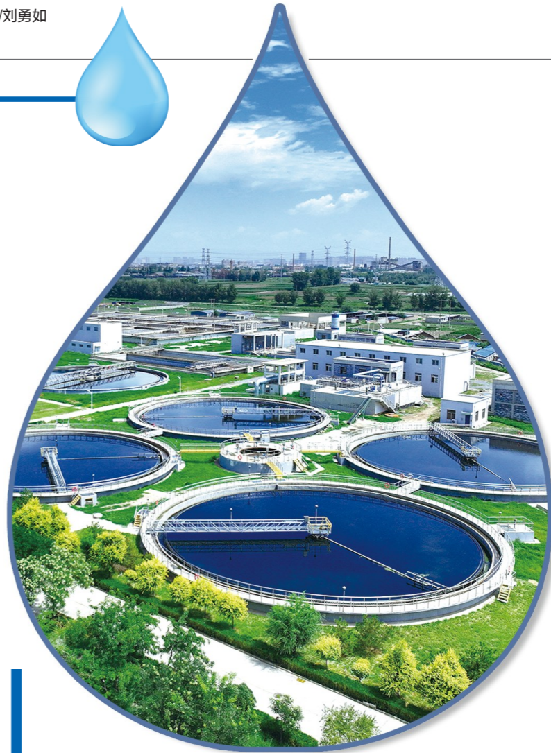
改造后的南郊污水厂

在市委、市政府坚强领导和系统谋划下，包头市城市管理局把再生水利用作为破解资源性缺水、支撑绿色转型的关键路径，统筹推进“源头治污-再生提标-体系输配-多元利用-机制创新”全链条改革，形成可复制可推广的“包头模式”，全市再生水利用率突破50%，在国家典型地区再生水利用率突破50%，在国家典型地区再生水利用率突破50%，在国家典型地区再生水利用率突破50%。