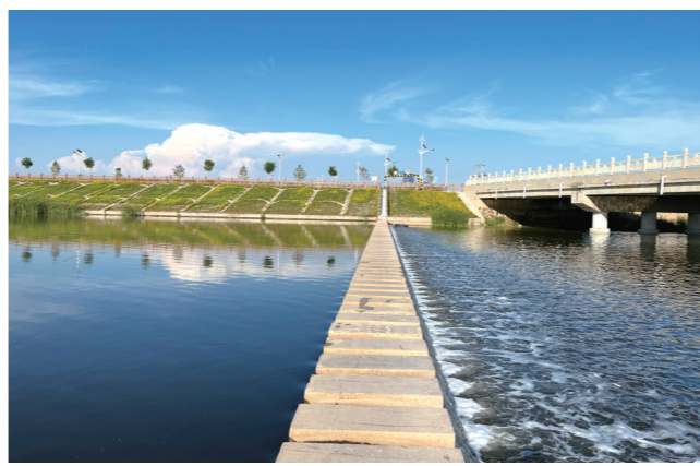
二道沙河生态补水