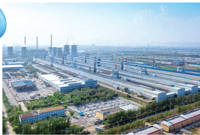
东方希望包头铝业全面使用再生水

今后，市城管局将继续在市级统筹下，围绕“提质、扩容、增效”，做强“厂网一体化”示范区，完善生态补水长效机制，推进全覆盖接入与全智能调度，持续放大“包头模式”的溢出效应，服务全市高质量发展与黄河流域生态保护大局，努力打造黄河流域再生水利用与水生态修复的示范城市。