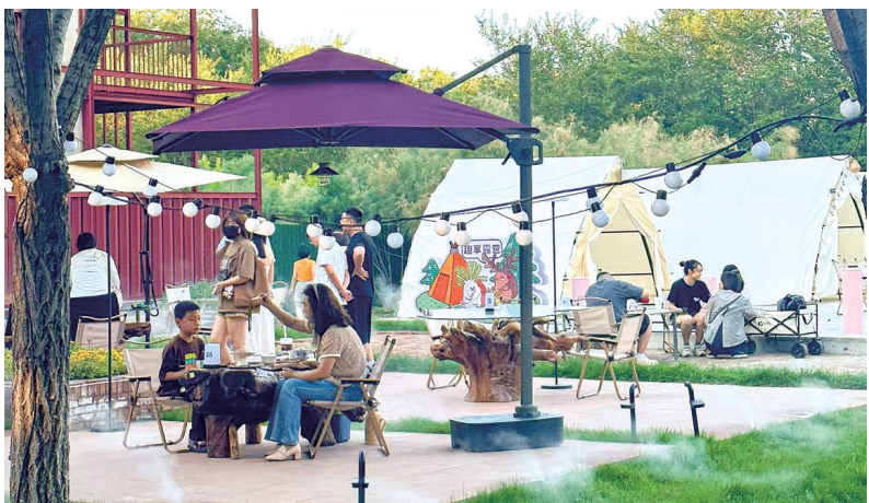
在浓密绿荫间感受惬意生活

一杯清茶配一卷书，邂逅午后的慵懒时光；寻味一餐鲜醇的涮羊肉，让热乎乎滋味抚慰味蕾，将整日疲惫一扫而空；静嗅香茗享片刻惬意，在墨香萦绕间找回本真的自己……这样藏着烟火与诗意里的慢生活，正是无数市民心向往之的疗愈日常。如今，在包头市阿尔丁植物园西园内，一座红色钢结构建筑悄然藏于浓密绿荫间，正成为承载这份美好惬意的新归处。这里不仅是即将完工的麓引民宿所在地，更是包头新晋的网红打卡地——阿尔丁麓引艺术文创社区。它不仅是城市文化新地标，更成为包头盘活国有闲置资产、助推文化经济发展的生动典范。