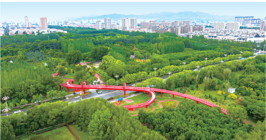
秋日的阿尔丁植物园绿意盎然

近年来,我市在大气污染治理领域奋勇前行,跑出加速度。“打赢蓝天保卫战要一盘棋、一条心,一以贯之、一干到底,需要0.1微克、0.1微克地去抠,抓住每一点改善的可能性。”市生态环境局党组书记、局长赵文彬告诉记者。