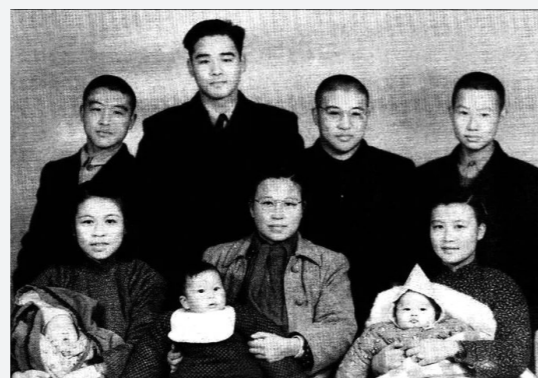
后排右二为许倬云(图片来源于《许倬云先生一生回顾》)

许倬云先生已逝，但他的智慧与温情将长留人间。后代一次次想起先生的追问：“未来的世界，工具性的理性或许可以发展到极致，但其目的与意义却没有人问。未来的世界，颠覆文化的人很多，却没有文化的承载者。知识分子还有没有张载所期许的四个志业？”