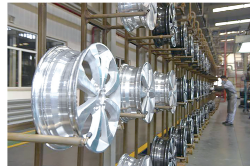
包头盛泰汽车稀土铝合金车轮生产车间