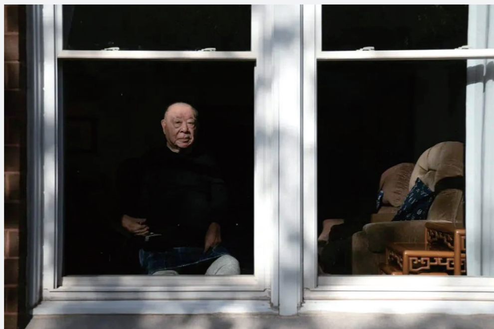
许倬云生前照(资料图)

2025年8月4日，著名历史学家许倬云先生逝世，享年95岁。许倬云早年以研究上古史闻名，晚年则着眼于大历史，年逾九旬之后仍然保持着旺盛的创造力，也会经常出现在镜头前与年轻人交流。 许倬云先生的表达更为活跃，仿佛有种时不我待的紧迫感——他在抖音、小红书上开了账号、两次接受《十三邀》访谈、在抖音直播中对话俞敏洪…… 作为当代华语世界最具影响力的史学大家之一，还出了《历史大脉络》《许倬云问学记》《许倬云观世变》《大国霸业的兴废》《经纬华夏》《中国文化的精神》等十多本新著，绝大多数是写给普通读者。 学者章我在《许倬云——家国情深，星斗其文》这样评价：家国情怀，大问题意识，以及济世的使命感。