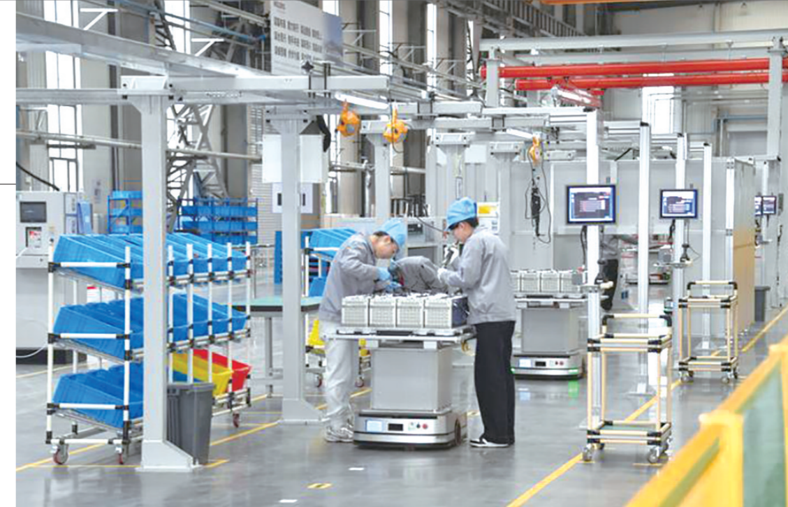
卧龙电驱稀土永磁电机项目生产线