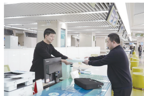
掀起审批效率“风暴”，点燃项目建设“新引擎”。