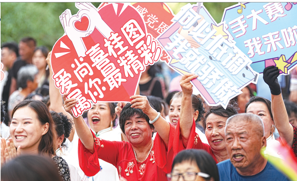
在“唱响真特图”石拐区首届社区歌手大赛上,居民们纷纷登台献艺,歌唱幸福生活。