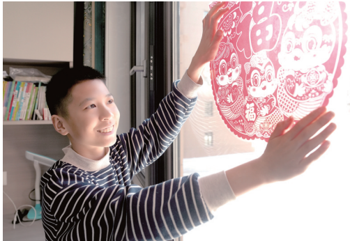
“卖心房”居民开心做在新居过年