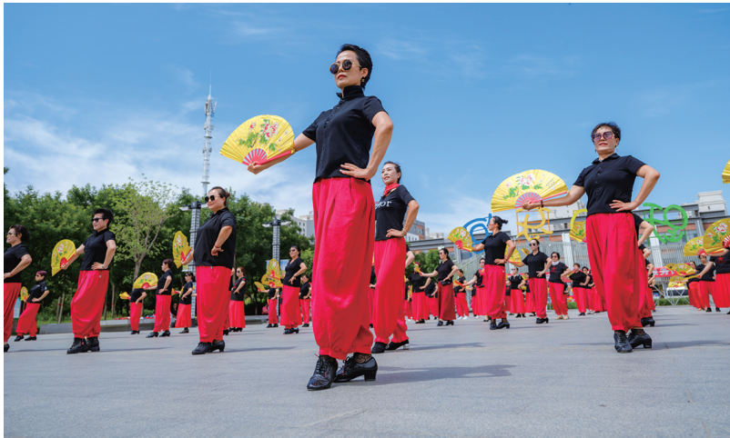
舞出好日子