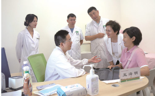
上海专家到我市义诊