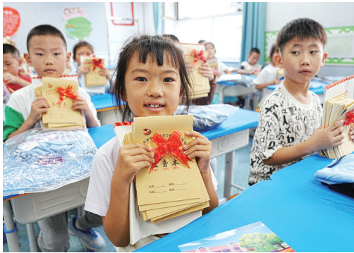
2024年秋季一年级新生入学这天,一年级新生对着镜头开心地展示老师精心准备的“学习礼包”。