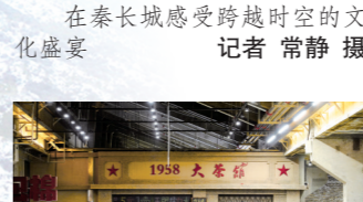
“包棉1958”里热闹非凡