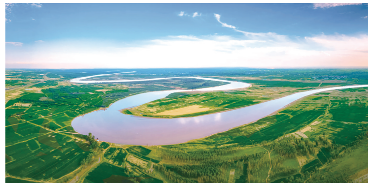
大河之滨