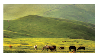
大美春坤山