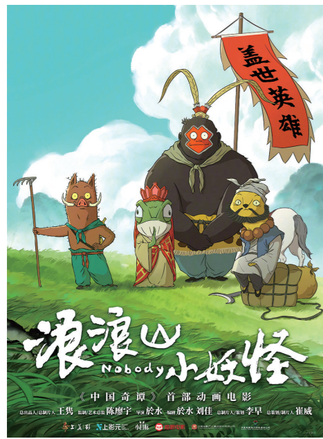
《浪浪山小妖怪》海报

8月,电影院还将迎来历史战争片《东极岛》、犯罪动作片《捕风追影》、国漫IP《浪浪山小妖怪》《非人哉:限时玩家》、喜剧《奇遇》《脱缰者也》,还有七夕爱情片《7天》《有朵云像你》。