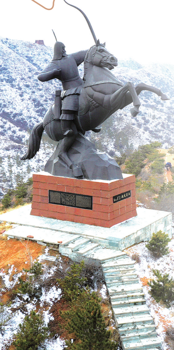
石拐区双塔山旅游景区胡昭明新塔塔基