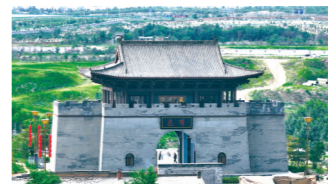
老包头走西口历史文化街区的包头城门