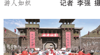
在秦长城感受跨越时空的文化盛宴