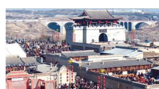
老包头走西口历史文化街区游人如织