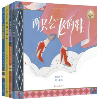
“给孩子的生命哲思绘本”系列书影